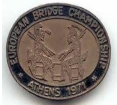
Το σήμα των αγώνων

Έτσι, το ελληνικό μπριτζ, χωρίς ακόμα να έχει αναγνωρισθεί από το Κράτος, απέδειξε ότι μπορεί να κατορθώσει τα ακατόρθωτα, αρκεί να υπάρχει ομοψυχία και μεράκι.